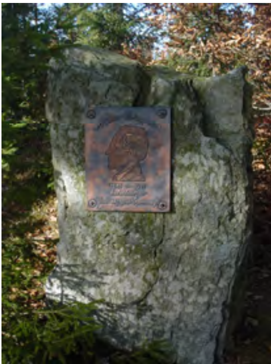
Gedenkstein für Peter Rosegger im Dichterhain in Zammelsberg, errichtet 1986, gesponsert von der Gurktaler Lehrerschaft.