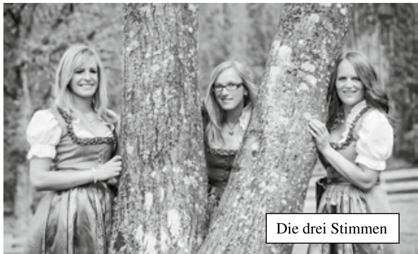
Die drei Stimmen

Danach kleiner Imbiss und Besichtigung des Heimes der Dichterstein Gemeinschaft Zammelsberg.