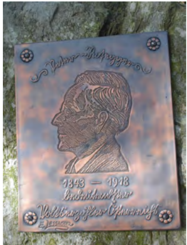
Gedenktafel am Stein, gestaltet vom Metallkünstler Ernst Lessacher (+)

Eine Geschichte aus Peter Roseggers „Das Sünderglöckerl“, aktuell zur momentanen Debatte über Studentenverbindungen.