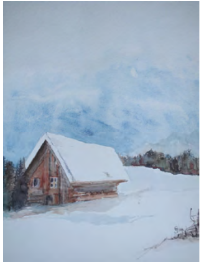
Marianne Seiler, Berghütte, Aquarell