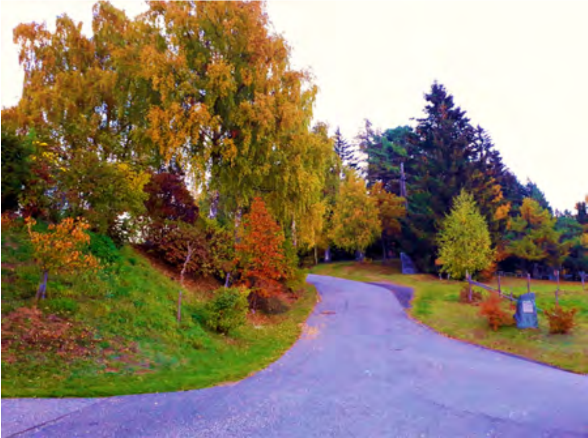
Besuch des Zammelsberger Dichterhains am 16. Oktober 2018