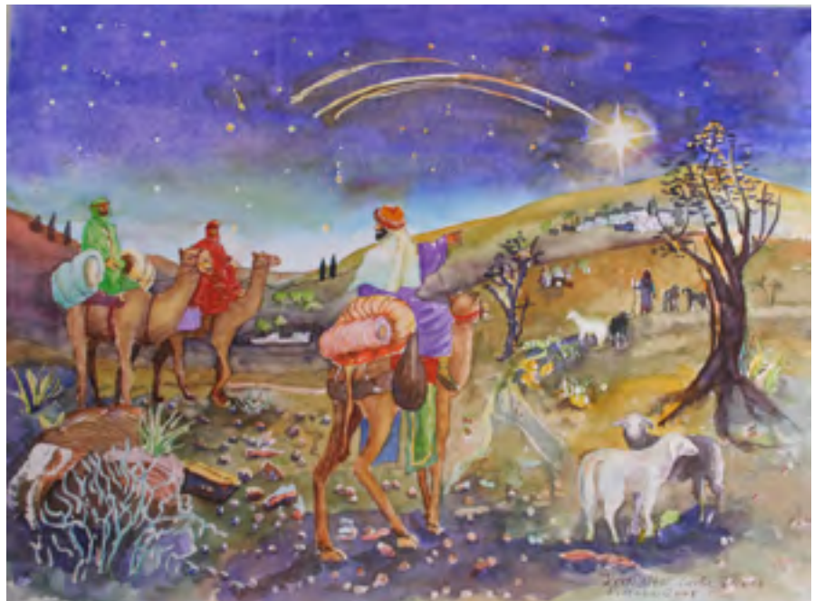
Gerhard Franz Kraßnitzer „Auf dem Weg nach Bethlehem“, Aquarell 56x42cm

Siegreich der Schöpfer Christkind im Stall Hör aller Menschen Flehn Ohnmacht der Weltsucht bringt uns zu Fall Mit Dir Gott in Jubel erstehn.