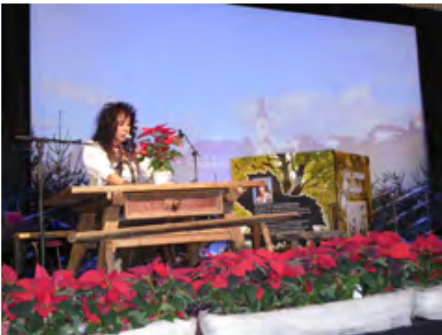
... und trug auf der Bühne heitere Gedichte in Mölltaler Mundart vor.