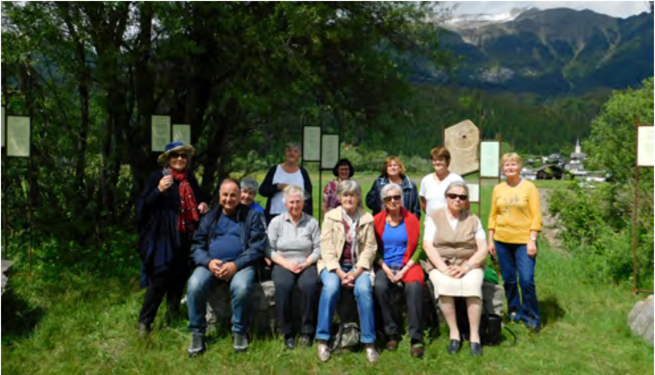
Der Gailtaler Literaturkreis am neu errichteten Kulturplatz „Kultur in der Natur“ an der Gail.