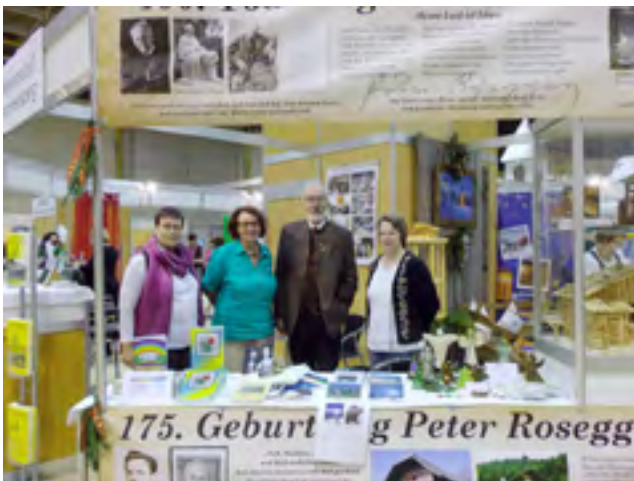
Am Stand bot sich ein buntes Bild.