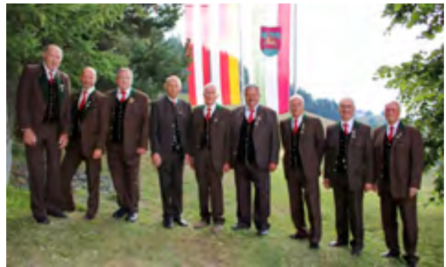
Der MGV „Erika“ aus Hermagor singt die Messe.