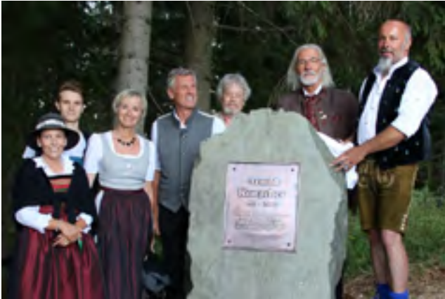
Re: Stadtrat Hannes Burgstaller (Hermagor).