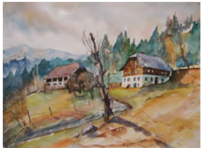
Gerhard Franz Kraßnitzer, „Bauernhof im Maltatal“, Aquarell, 48cm x 36cm