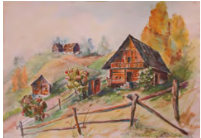
Gerhard Franz Kraßnitzer, „Maltaberg“, Aquarell, 43cm x 30cm