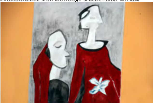
Mathilde Steiner stellte Bilder zum Thema „Köpfe“ aus.