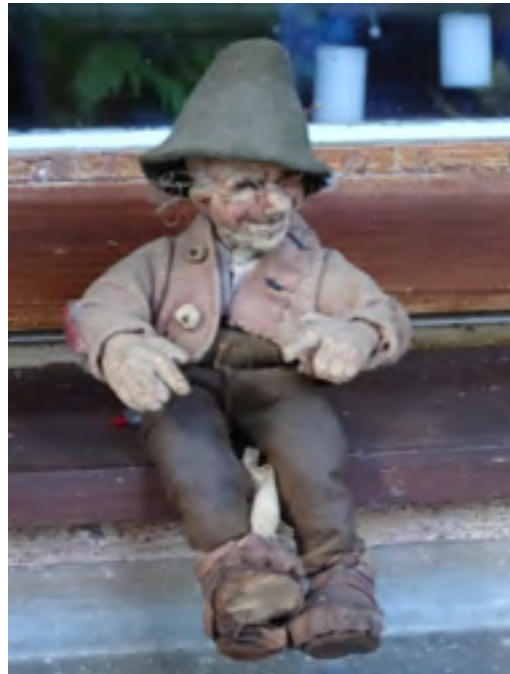
„Wutzl“ plastisch dargestellt von Puppenkünstlerin Elli Eiehl.

her im „Wutzlhaus“ auf einer Truhe. „Der Wutzl“ erschien 1946, wurde 1964 neu aufgelegt, es ist mit der Widmung „Für meine Kinder“ versehen, was die Verbundenheit mit Familie und Kärnten aufzeigt.