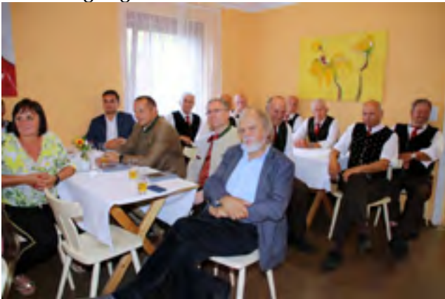
Alle lauschen ...