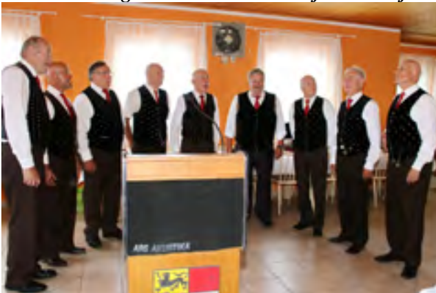
Gesangliche Umrahmung: MGV Erika Hermagor