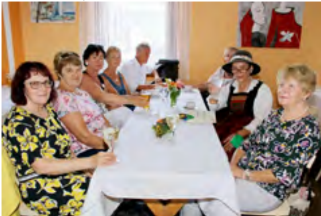
Stark vertreten: Autorinnen aus dem Gailtal.