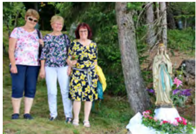
Drei Autorinnen des Gailtaler Literaturkreises.